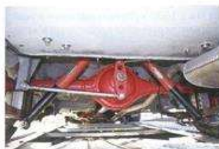
В свободном классе «Москвич» можно использовать параллелограм Уатта в задней подвеске, но резать или раскатывать колесные арки запрещено

ка, достаточно коротко отпустить педаль газа, чтобы Иж взял более крутую траекторию.