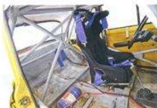
Для олдтаймеров нет скидок на безопасность: современные каркасы, система пожаротушения и гоночное сиденье