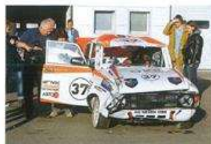
После нескольких переворотов Иж-412 Натальи Гольцовой выглядел особенно грустно.