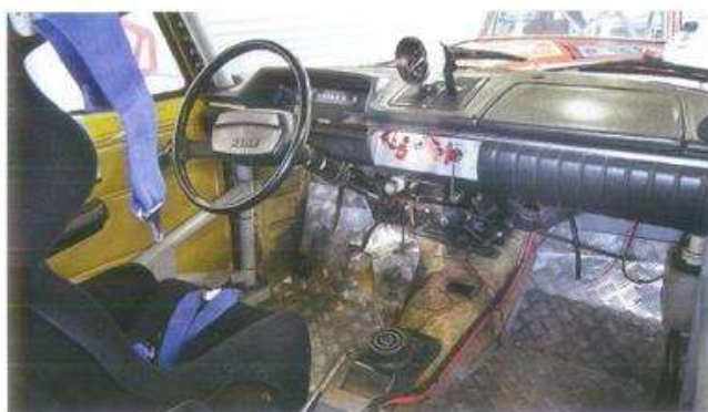
Гоночные приборы не увеличивают скорость, а со стандартным интерьером сохраняет оригинальный уют. В центре — тахометр от вазовской «шестерки». Оригинальный механизм переключения передач требует аккуратности и нежности

Да-да, заплатив всего от пяти до пятнадцати тысяч рублей стартового взно-