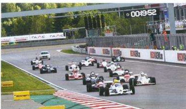
Почти все «формулы» — советские Эстонии с пространственными металлическими рамами и внешними панелями из стеклопластика. Помимо россиян и прибалтов, в заезде «формулы» участвовали представители немецкой серии HAIGO, в которой гоняются на машинах из стран Восточного блока

и прелесть очной гонки, что здесь может случиться что угодно. Старт! Эх, хорошо рулится фактически стандартный Иж-412: на 15-дюймовых колесах с шинами Toyo Proxes R1R размерности 195/55 он позволяет очень тонко играть характером поворачиваемости. Все так ожидаемо, что и не скажешь, будто это олдтаймер. Можно резким движением руля сорвать его в небольшое скольжение всеми четырьмя колесами, как в первом быстром повороте трассы Moscow Raceway. Или, наоборот, мягко встать на дугу и рано открываться, нащупывая предел сцепления шин. А если скорость на дуге слишком вели-