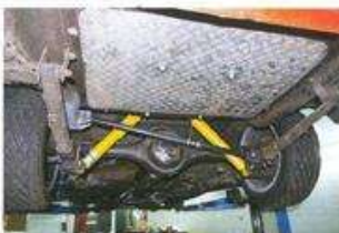
В задней подвеске Москвичей проставки между рессорами и мостом (для того, чтобы опустить кузов), тяга Панара и спортивные амортизаторы. А спереди, помимо укороченных на два с половиной витка пружин, доработан талько стабилизатор поперечной устойчивости

Жаль только, что соревнования проходят по понедельникам. В этот раз он оказался выходным, и зрители были. Здесь ведь есть на что посмотреть. Так что если приедете на второй этап, который пройдет на Moscow Raceway 4 июля, не пожалеете. ☺