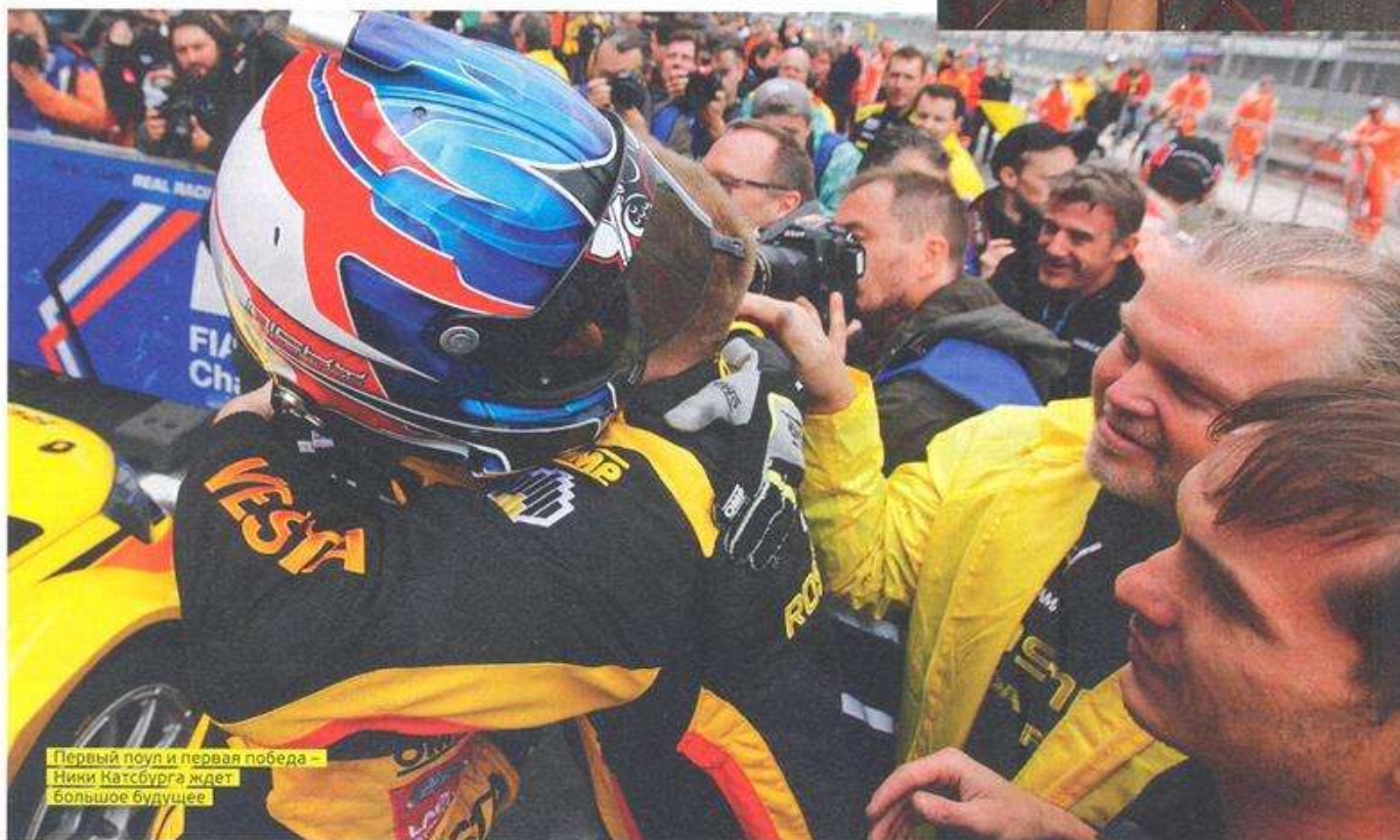
Первый поул и первая победа – Ники Катсбурга ждет большое будущее.