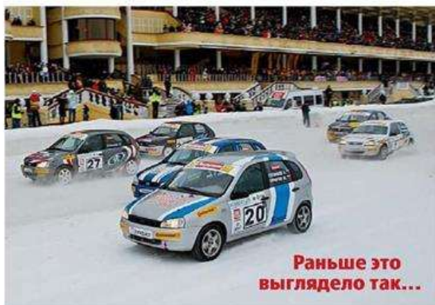
Схема заездов остается почти такой же, что была позапрошлой зимой. Сначала – отборочная стадия. Пилотов поделят на две подгруппы по итогам квалификации. В каждой подгруппе пройдут две короткие гонки. Три сильнейших пилота из каждой подгруппы встретятся в суперфинале, состоящем из трех заездов по одному кругу.

Но по всем остальным понятиям, народным и природным, это всё-таки лето. Летним будет и покрытие на подмосковном автодроме Moscow Raceway – асфальт.