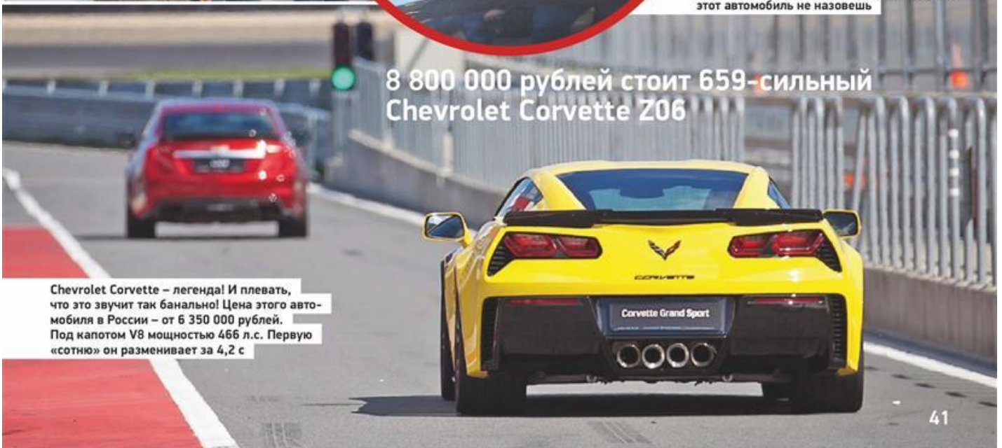
Chevrolet Corvette – легенда! И плевать, что это звучит так банально! Цена этого автомобиля в России – от 6 350 000 рублей. Под капотом V8 мощностью 466 л.с. Первую «сотню» он разменивает за 4,2 с

8 800 000 рублей стоит 659-сильный Chevrolet Corvette Z06