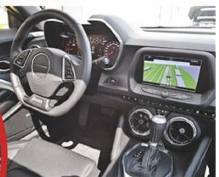
Chevrolet Camaro – настоящий шоу-кар. Любое появление этого автомобиля на дороге гарантирует его владельцу всеобщее внимание и восторженные возгласы. Однако за народную любовь приходится платить собственным комфортом. Удобным этот автомобиль не назовешь

8 800 000 рублей стоит 659-сильный Chevrolet Corvette Z06