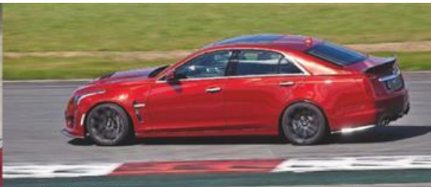
Cadillac CTS-V: 649 л.с. мощности, разгон до 100 км/ч – 3,7 с, максимальная скорость – 320 км/ч